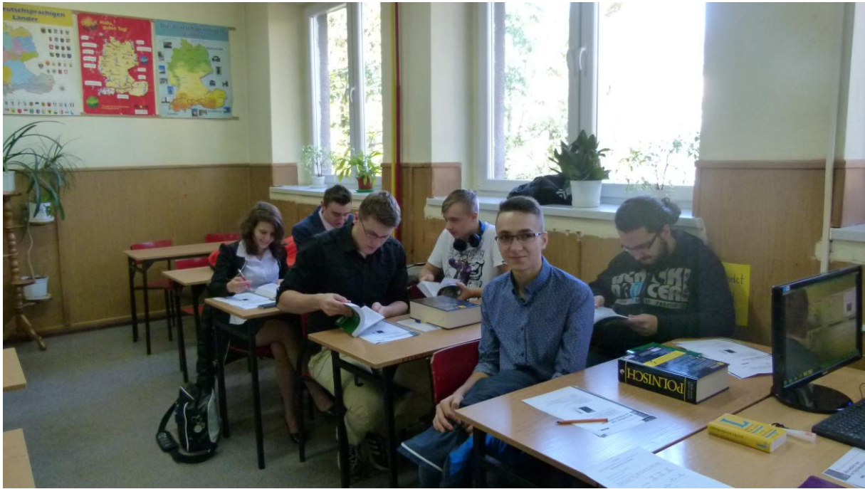
Mechatronicy za zajęciach z języka niemieckiego branżowego.