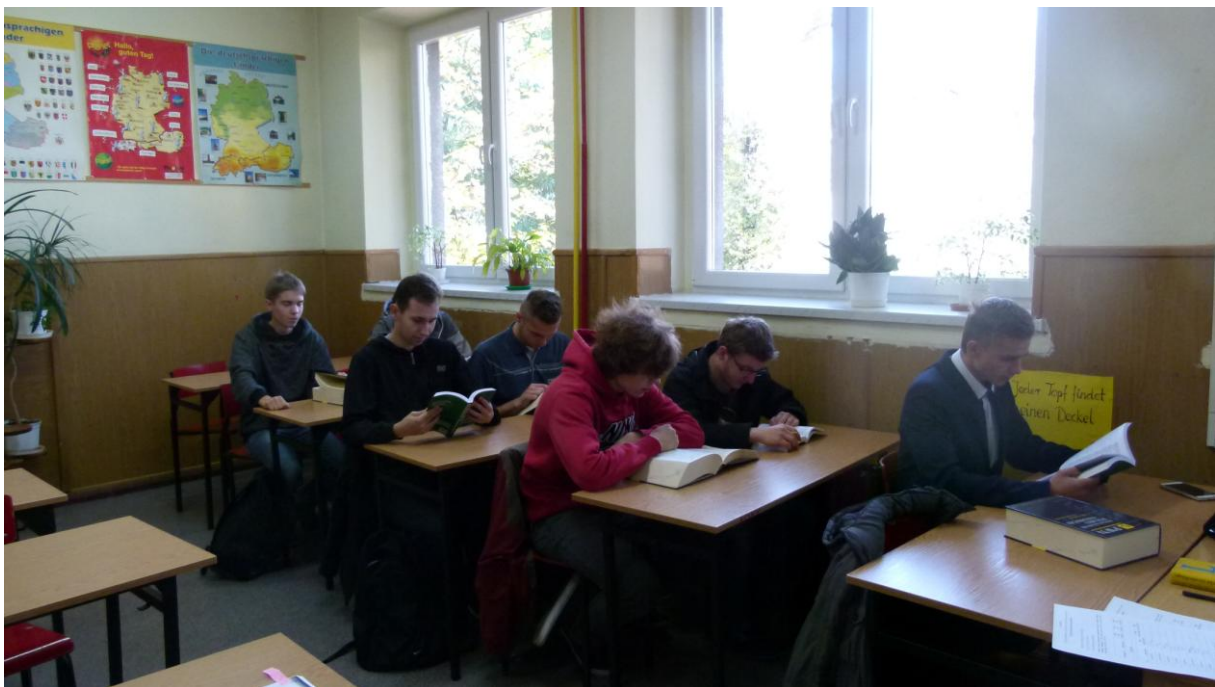
Elektronicy za zajęciach z języka niemieckiego branżowego.